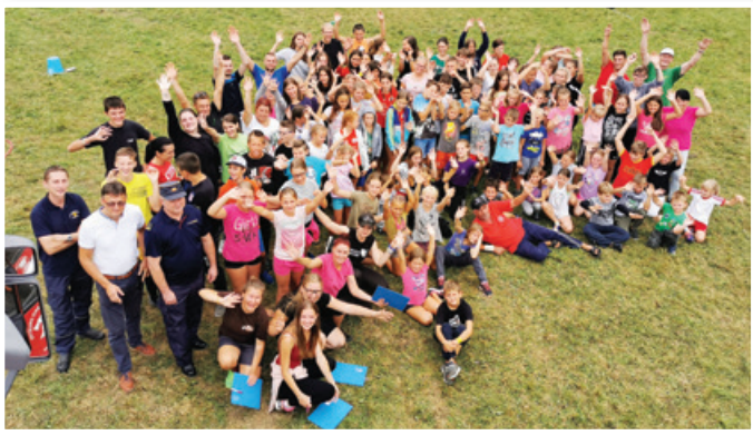
9. tabor gasilske mladine GZ Lenart

Brez pretiravanja lahko trdimo, da so ženske pomemben del gasilstva. Delujejo v društvih, kjer opravljajo številne naloge: so podpora svojim operativnim članom (gasilstvo je v veliki meri družinska tradicija), so tajnice, blagajničarke, mladinske mentorice in v zadnjem času tudi enakovredne članice operativnih enot – kot fantje in može imajo potrebna specialna znanja. Letos so pripravile in uspešno izvedle že 7. operativno vajo za članice GZ Lenart. V njej se sodelovalo 57 gasilk; dobro delo v komisiji za članice je bilo nagrajeno s tem, da je bilo predsednici naše komisije zaupano vodenje regijske