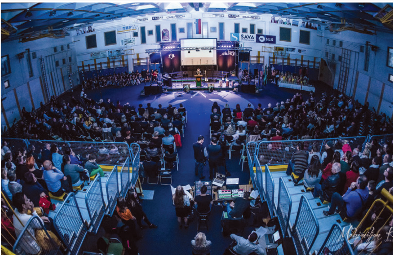
Osrednja proslava ob lenarškem trojnem prazniku ...