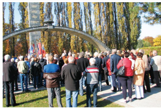
Spomenik je delo nekdanje Granitne industrije iz Oplotnice. Odkrit je bil 1. novembra 1961.

74 let po koncu najhujše morije v sodobni zgodovini Evrope si mnogi izmed nas le stežka predstavljamo, v kakšnih razmerah so v vojnih letih med 1941 in 1945 živeli naši ljudje. To