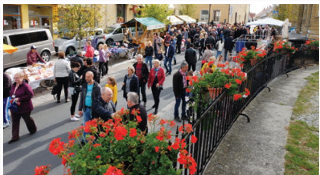
Praznik Sv. Lenarta ...