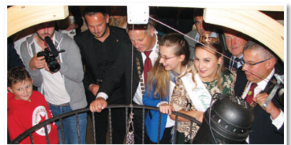
V pričakovanju lansko leto v vodnjak spuščene penine