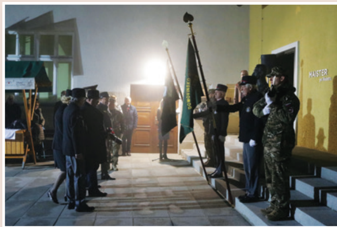
Položitev vencev na 34. Maistrovih prireditvah v Zavrhu