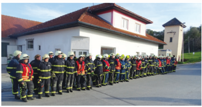
7. operativne vaje za članice GZ Lenart

Gasilski vodje pa morajo zaradi svoje odgovornosti opraviti tudi ostala temeljna in dopolnilna izobraževanja in usposabljanja. Svoje bogato znanje v praksi prenašajo na mlajše rodove – preko intervencij in vaj; pomemben del njihovega delovanja pa so tudi izobraževanja, saj so številni od njih tudi inštruktorji in sodelujejo tudi pri izvedbi tečajev za mlade rodove.