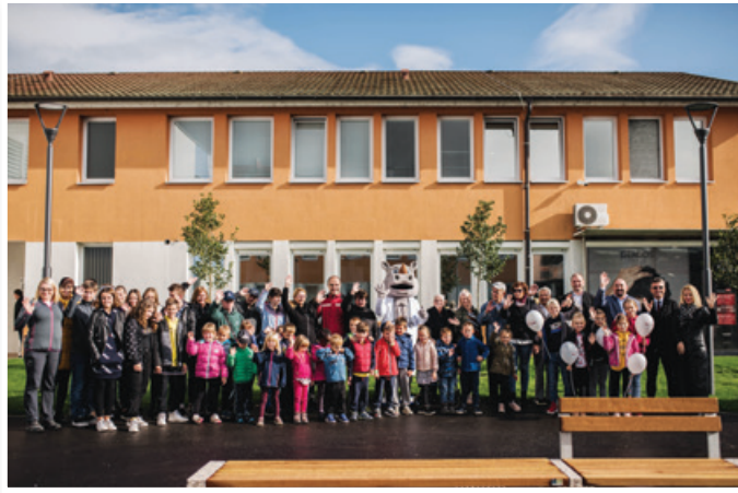
Otroci iz vrtca Lenart in uporabniki VDC POLŽ MB, enota Lenart ter starostniki Doma sv. Lenart so skupaj z zdravnikom Rafkom - nosorogom, ki je maskota ZD Lenart - posadili drevesa kot simbol življenja in medgeneracijskega povezovanja.

Vsredo, 6. novembra 2019, je na ploščadi pred Zdravstvenim domom Lenart potekala slovesnost ob otvoritvi novih prostorov Zdravstvenega doma Lenart, v katerih se bodo izvajale aktivnosti preventivnih zdravstvenih programov v okviru Centra za krepitev zdravja (CKZ). Z izvedeno nadzidavo in prizidavo vhodnih prostorov z dvigalom in stopniščem je Zdravstveni dom Lenart pridobil dodatnih 398,7 m 2 površin v neto vrednosti 299,81 m 2 . Slavnostna govornica je bila mag. Mojca Presečnik, vodja Službe za izvajanje kohezijske politike na Ministrstvu za zdravje. Praznovanje so pričeli že v dopoldanskih urah, ko so na novo urejeni zelenici pred ZD otroci iz vrtca in Osnovne šole Lenart posadili sadiko lovoričevca kot simbol življenja in medgeneracijskega povezovanja, po eno so posadili tudi uporabniki lenarške enote VDC Polž Maribor in starejši iz Doma sv. Lenarta s pomočjo zdravnika Rafka, nosoroga, maskote ZD Lenart.