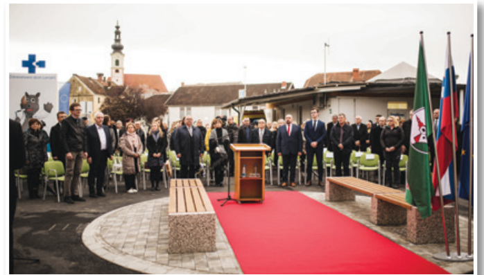
Otvoritve se je udeležilo približno 300 ljudi.