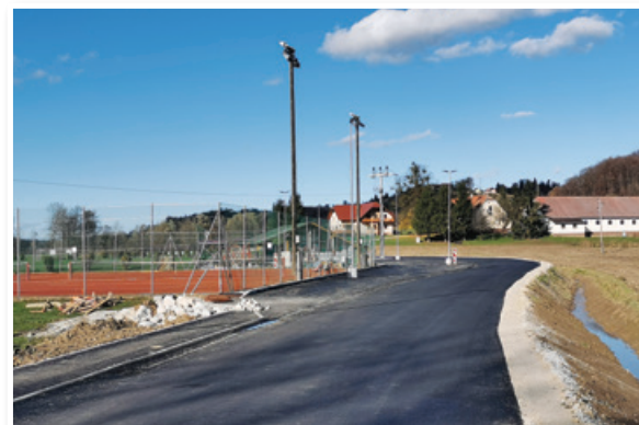
Ob telovadnici na prostem nova razsvetljava in parkirni prostor