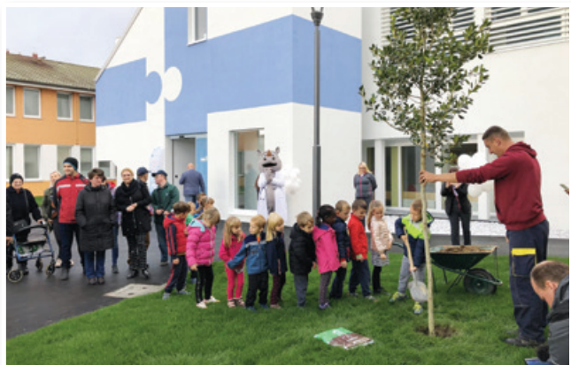
Ob odprtju novih prostorov Zdravstvenega doma Lenart ...