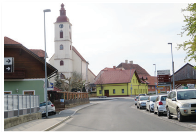
V Občini Sveta Ana so v minulih letih izvedli vrsto prednostnih investicij na področju komunale, kanalizacije, oskrbe z vodo, varovanja okolja in izgradnje čistilnih naprav, urejanja naselij, kulture in izobraževanja, sedaj pa je na vrsti modernizacija cest na kmetijskih območjih.

Prav tako namerava Občina Sveta Ana obnoviti cesto Ledinek–Kraner, ki se projektno deli na odseka A in B. Skupna dolžina obeh odsekov je 208 metrov. Obstoječa cesta je v makadamski izvedbi, široka pa je 3 metre. Služi kot dostopna pot do posameznih domačij. Po modernizaciji bo vozni pas širok 3,5 metra, skupaj z muldo in bankino pa bo cesta široka 4,75 metra. Investicijski stroški so ocenjeni na 37 tisoč evrov. Dobrih 18 odstotkov potrebnih sredstev bo prispevala Občina Sveta Ana, skoraj 82 odstotkov nepovratnih sredstev pa bo zagotovilo ministrstvo za gospodarski razvoj in tehnologijo po 23. členu zakona o financiranju občin. Gradbena dela bodo izvedli v letu 2020.