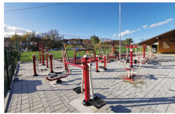
Nova telovadnica na prostem v Jurovskem Dolu

Poezije pod Roškarjevo trto, o kateri podrobneje poročamo posebej, in Pričakajmo mlado vino pod Roškarjevo trto.